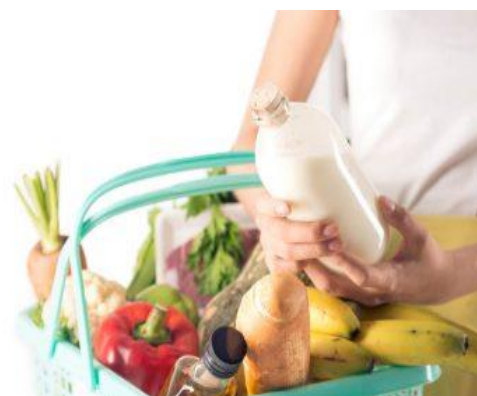
Comportamiento del costo promedio mensual de la CBA en Tegucigalpa y SPS al cierre de noviembre de 2021 (En Lempiras)